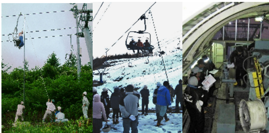
予備原動装置取扱訓練