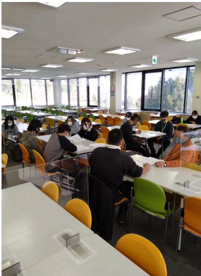
予備原動装置取扱訓練