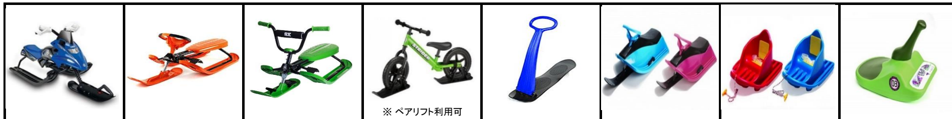
スノーレーサー 各種類似品

( 条件: ・エッジ無し ・金属製以外の滑走板 ・足を出してブレーキがかけれるもの )