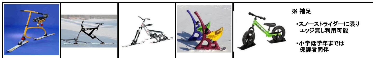
●スキーバイク 各種類似品

( 条件: ・エッジ付き ・リーシュコード必需 ・滑走板3枚までのもの ・リフト乗降の際、停止させる必要なく安全に乗れるもの )