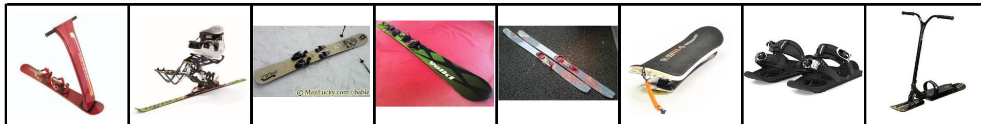
●スノーボード ハンドル付