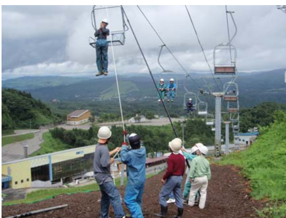
夏季ゆり園救助訓練