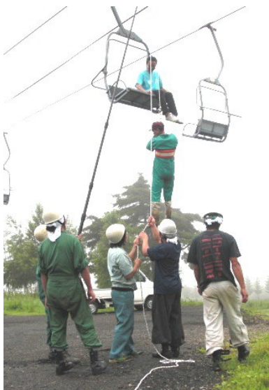
夏季ゆり園救助訓練